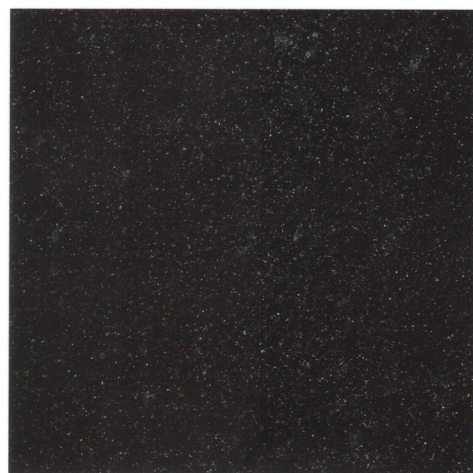
60 x 60